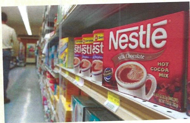
Nestle a la mira de Lemann

Con una gestión corporativa perfecta, el Grupo 3G adopta valores como la meritocracia, partnership, espíritu de equipo, reducción de costes, y, como publicó la revista brasileña Exame en 2000, con "colaboradores con cuchillo entre los dientes y sangre en los ojos", su gran activo intangible; consiguiendo ser uno de los mas grandes barcos pesqueros del mundo, haciendo estremecerse hasta a las grandes ballenas.