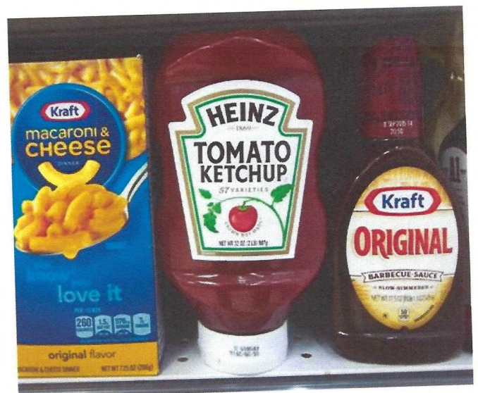
Fusión entre Heinz y Kraft